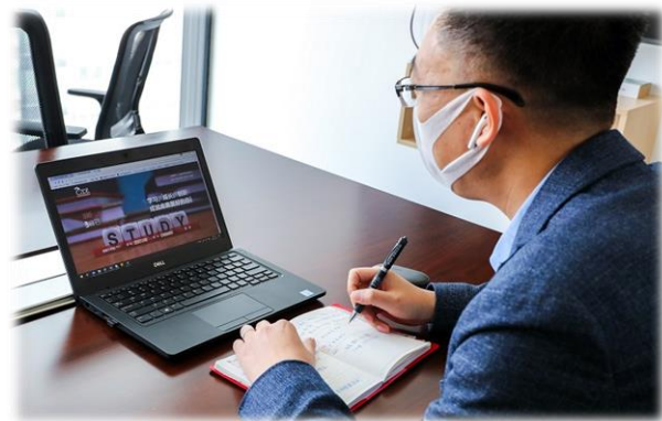
佳能（中国）通过佳能云学院为合作伙伴提供丰富的产品技术和管理经验

“将挑战转化为胜利，一如既往地对中国市场充满信心，2020年将全面发力，与所有合作伙伴、员工一起携手前进，共克时艰并实现持续不断的胜利，需要大家一起努力、迎接挑战。”