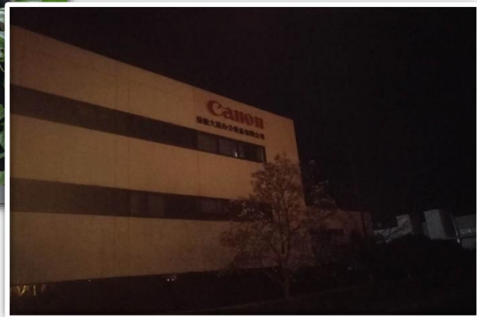
佳能大连办公设备有限公司熄灯情况