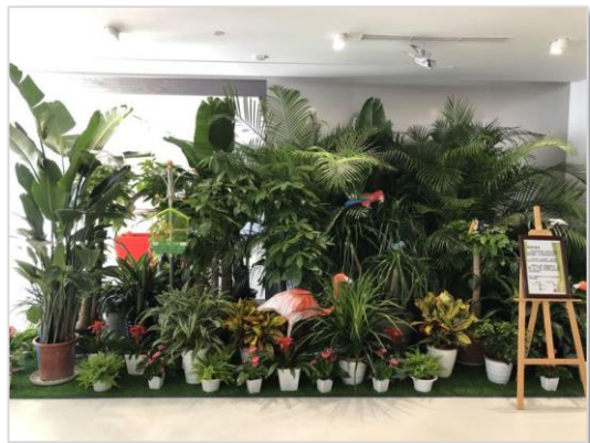
总部前台的“小森林”

佳能（中国）总部在前台布置了生机盎然的“小森林”，这片森林中不仅有郁郁葱葱的植物，还有趣印乐园（Creative Park）制作的鸟类纸模型，甚至还有两只真正的鸟儿，让员工在办公室内感受到了鸟语花香和勃勃生机。