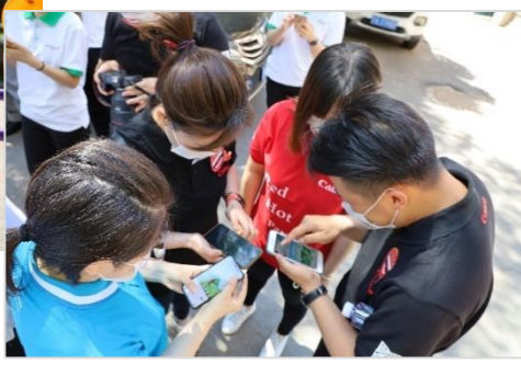
左图一 清理楼道小广告 左图二 为公用健身器材喷漆 左图三 线上为蚂蚁森林公益林浇水