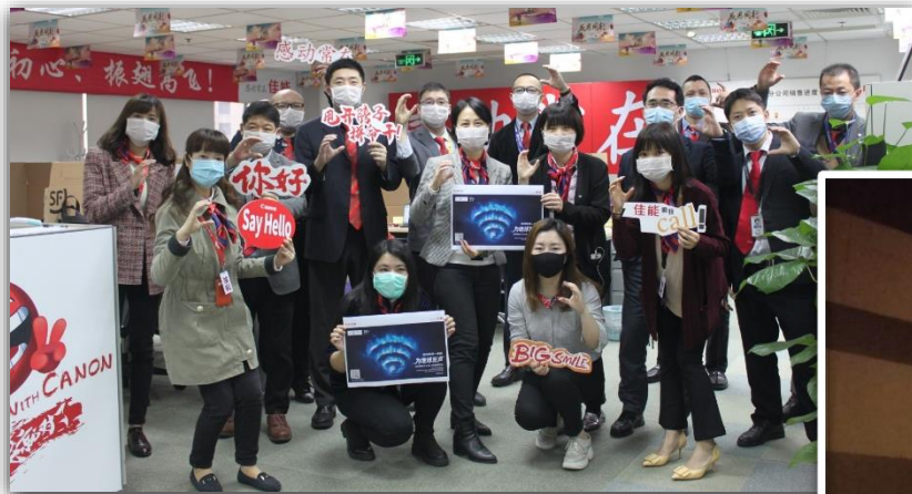
佳能（中国）有限公司重庆分公司组织学习及宣传地球一小时活动合影

其中佳能医疗器械（大连）有限公司还计算出本次活动共计节约67.3千瓦电能，这只是一小时的节电量，每天为节约能源迈出一小步，日积月累能为地球减负迈出一大步。