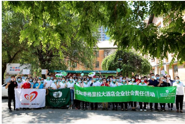
佳能（中国）沈阳分公司、香格里拉大酒店联合社区工作人员 携手为环境美化做贡献