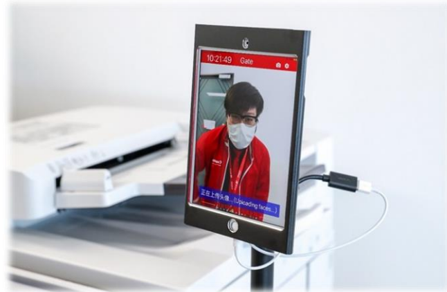
企业用户使用戴口罩人脸识别解决方案进行办公打印

分享技术经验，与行业伙伴共克时艰。 佳能（中国）面向广大行业合作伙伴开放云学院平台，提供丰富的产品技术和销售培训资料，同时还上线直播课程，分享疫情期间企业经营方面的策略和方法，助力合作伙伴顺利度过困难时期。此外，佳能（中国）还在该平台上新增了“防疫爱心专栏”，指导大家在上门维修、拜访客户时如何做好自我防护等措施。疫情期间，合作伙伴们足不出户就可以轻松在线学习各种产品技术和管理经验，目前已经有上千位行业伙伴参与其中。