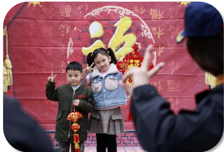
两个身着漂亮衣服的孩子对镜头开心比“耶”

1月8日，正值春节来临之际，佳能（中国）有限公司广州分公司联合广东新快报、广东省摄影家协会等单位，再次启动了“广东红色文艺轻骑兵 送幸福大片”摄影公益活动。今年，“送幸福大片”活动走进江门市开平市塘口镇祖宅村，用影像记录美丽乡村，用镜头定格村民们的幸福笑脸，为他们送上一份特别温暖的新年祝福。