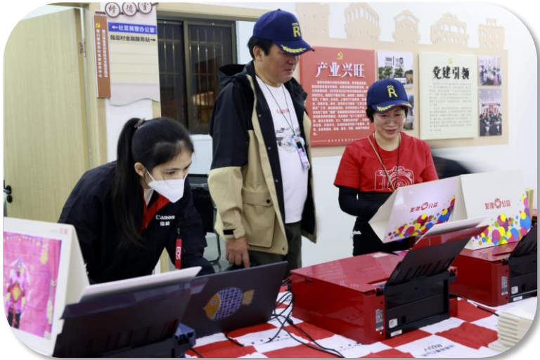
紧锣密鼓的打印现场