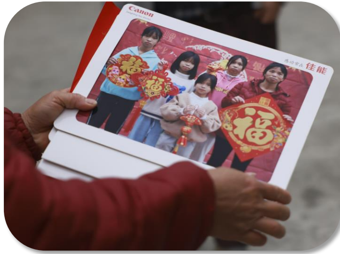
打印之后送到村民手中的照片

自2011年起，“送幸福大片”活动已开展12次，快门敲响在偏远的小山村、小渔村、远离大陆的岛礁……一张张“全家福”，在中国的传统节日里给无数人带去了温暖的小确幸，在此起彼伏的快门声中，一幕幕幸福影像被一一定格。