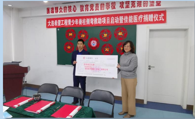
CMED向大连市青基会捐赠18万元

大连希望工程青少年脊柱侧弯救助项目专项公益基金，是为让更多家庭困难脊柱侧弯青少年得到及时救助，由市青基会、市二院和CMED共同发起成立。该项目联合专家团队对家庭困难的脊柱侧弯儿童及青少年患者提供科学干预措施和资金资助，避免因家庭困难，拖延治疗，对患儿造成不可逆的损伤，实现疾病“早预防、早发现、早治疗”。基金将为符合条件的困难家庭儿童及不超过20周岁的青少年患者提供不超过6万元/人救助资金支持。