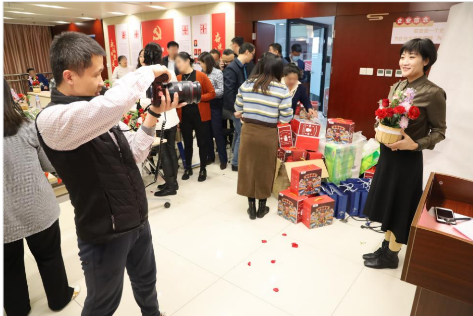
活动现场，佳能员工使用佳能相机为到场女会员拍摄照片

3月3日，佳能（中国）济南分公司一行5人来到山东金辰亚公司，参与由济南市信息技术服务业协会（以下略称“信息协会”）主办的妇女节活动。山东金辰亚公司是佳能（中国）打印机部门的经销商伙伴，其总经理作为信息协会副会长，引荐佳能（中国）参与了本次活动。当日共有30位信息协会的成员进行了插花、拍照打印体验，并学习了摄影技巧。