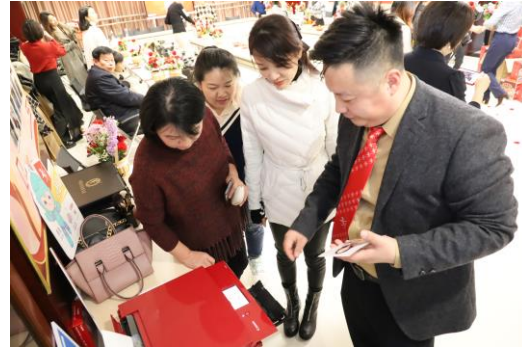
使用佳能打印机即时打印