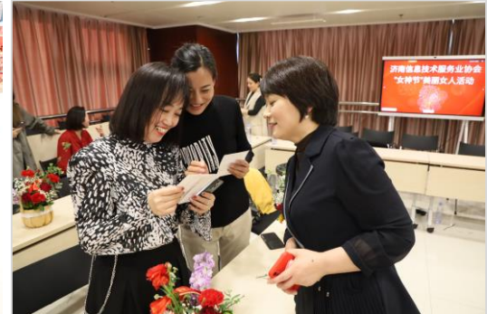
看到照片，大家都露出满意笑容

佳能以饱满的色彩最大程度呈现女性之美。佳能（中国）积极参与本次活动，希望助力“她”发现美、记录美，在美中寻找“她自信”和“她力量”，全力赋能女性发展，不断激发独特的创新活力，投身各行各业的高质量发展。