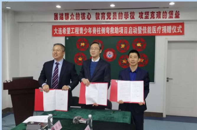
三方签订项目合作协议

“感谢CMED多年来支持希望工程事业、关心困难家庭青少年健康成长，希望更多的社会企业像CMED一样，参与和支持希望工程事业。”