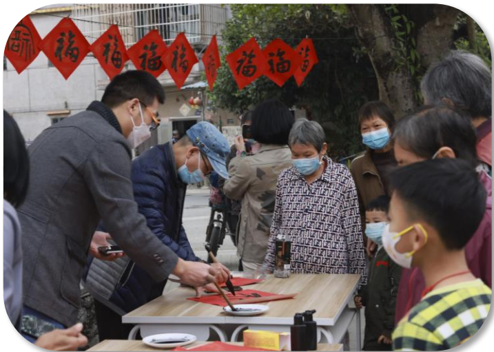
争相领取福字和春联的村民们

2023年伊始，祖宅村的村民们纷纷忙着洒扫庭院、置办年货，准备迎接即将到来的兔年新春。“送幸福大片”团队通过手中的佳能相机，将这一派繁荣的忙年景象定格记录，并用佳能打印机将全家福照片打印装裱，及时送到村民手上，为他们的新年装饰增添了一抹亮眼的感动记忆。志愿者们还在现场为村民写福字、春联，一副副寓意吉祥的春联在行云流水间新鲜出炉，满载着祝福与希望陆续送到村民手中，每个人脸上都洋溢着笑容，现场一片喜庆祥和。